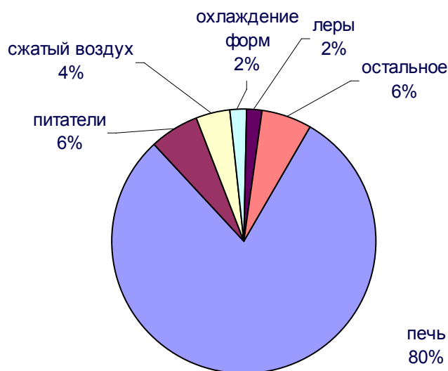
Рисунок 1. Потребление энергии на типичном стеклотарном предприятии

Энергия, необходимая для стекловарения, обычно составляет более 75% общего энергопотребления производства тарной продукции из стекла. Другими значимыми областями, связанными с потреблением энергии, являются питатели, процесс формования (сжатый воздух и воздушное охлаждение форм), отжиг, обогрев и обеспечение предприятия. Типичное распределение потребления энергии приведено на рис. 1.